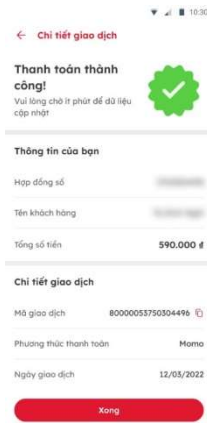
Hình 4: Giao diện sau khi thanh toán khoản vay thành công