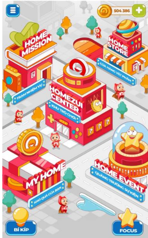
Hình: Giao diện “HomeTown – Phố Home”