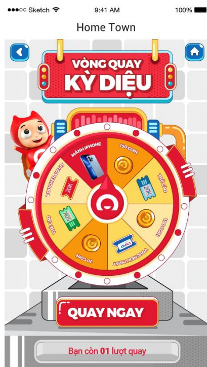
Hình: Giao diện Vòng Quay Kỳ Diệu

Khách hàng nhấp vào màn hình để sử dụng lượt quay. Hệ thống sẽ hiển thị ngẫu nhiên 01 trong những kết quả của vòng quay.